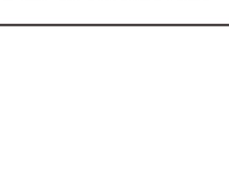
校报编辑部官方微信