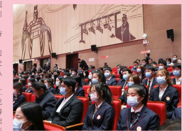
(文/毛华中)

党史学习教育是我校当前和今后一个时期的重要政治任务。今后,学校把把党史学习教育融入教书育人的全过程,牢牢把握“学党史、强信念、育新人”的鲜明主题,突出教育特色,全面统筹推进,不断创新学习形式,深入开展有特色、有形式、有内容、有创新的党史学习教育,引领全体党员干部、师生员工增强“四个意识”、坚定“四个自信”、做到“两个维护”,进一步加强党对学校工作的全面领导,执行党的教育方针,坚持社会主义办学方向,把立德树人作为根本任务,加强内涵建设、突出办学特色,提高办学水平,培养德智体美劳全面发展的中国特色社会主义合格建设者和可靠接班人,服务国家现代化建设、区域经济社会发展,为中原更加出彩做出更大贡献。