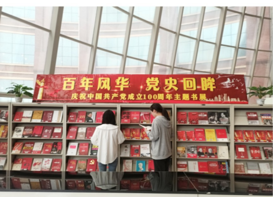
图片新闻:图书馆举行庆祝中国共产党成立100周年主题书展。

通过观看纪录片,我校师生深刻领会和掌握了总体国家安全观的重大意义和精神实质,树立了国家安全人人有责,人人尽责,国家安全一切为人民,一切依靠人民的观念,增强了依法规范和打击危害国家安全行为的法律意识,提高了履行法律义务的自觉性,为维护国家安全营造了良好的法制氛围。(文/毛华中)