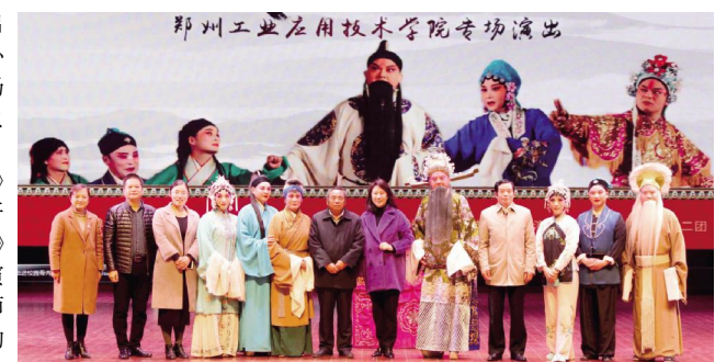
图为学校领导与省豫剧二团的艺术家们合影