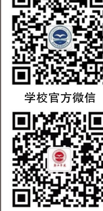
校报编辑部官方微信