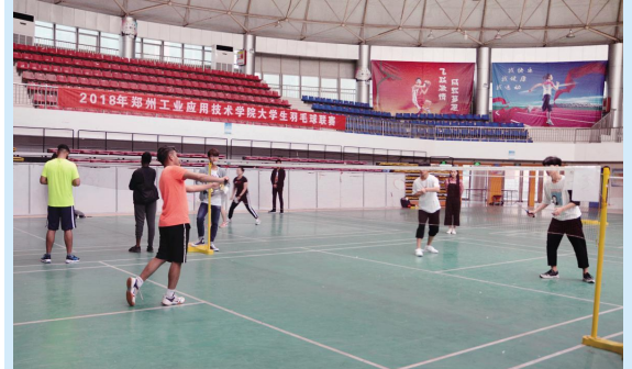
图片新闻:4月25日,我校大学生羽毛球联赛在学校体育馆开赛,来自全校各学院的近百名师生参加了比赛。

“李博士的讲座很接地气,对我触动很大。我也要向李博士学习,合理规划自己的学业和人生,做一个人生的强者。”建筑工程学院的一名学生说。(文/赵起慧)